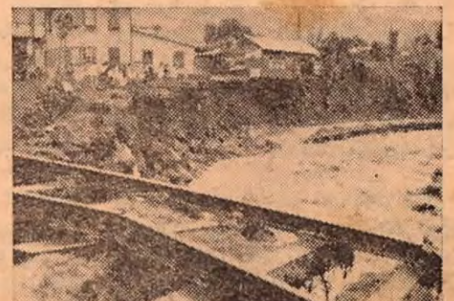
Véase como quedó la línea férrea en esos días después de la inundación de Turrialba.