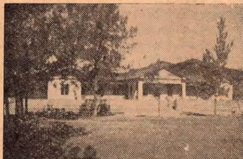
La linda Escuela del Cantón de San Marcos de Tarrazú.