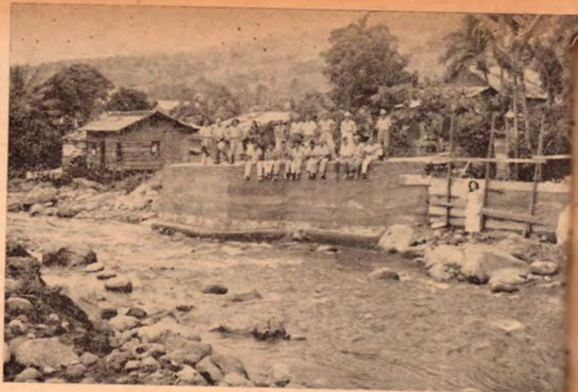
Vista parcial del primer espolón del sistema de defensa que la Municipalidad de Turrialba está construyendo bajo la dirección técnica del Ministerio de Obras Públicas, con el fin de salvaguardar la ciudad de futuras inundaciones. Obra que responde al afán de progreso de dicha Municipalidad.

1895, por medio del Decreto N° 73 del Congreso de entonces, se vota una regular suma de dinero para que se habilite la carretera que la ha de enlazar al valle de Tuis y su apertura; y muy antes, el 31 de mayo de 1831, la Asamblea Constitucional emitió un Decreto agraciando con una manzana de tierra a quienes cultivaran el cacao a todo el largo de Quebrada Honda a Turrialba en el camino de Matina, en realidad Turrialba no