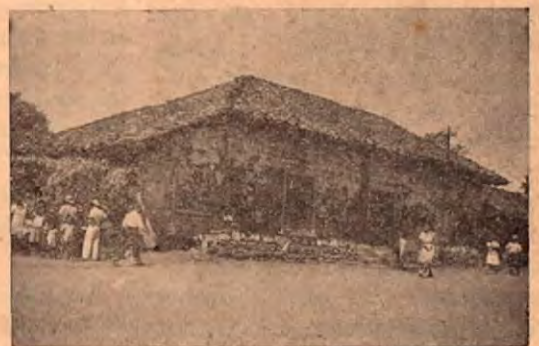
La Casa Centenaria de Nicoya