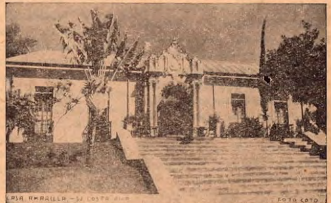
Antigua Casa Centro América. Hoy está allí la Cancillería de Relaciones Exteriores.

Frente al costado Este del Teatro Raventós