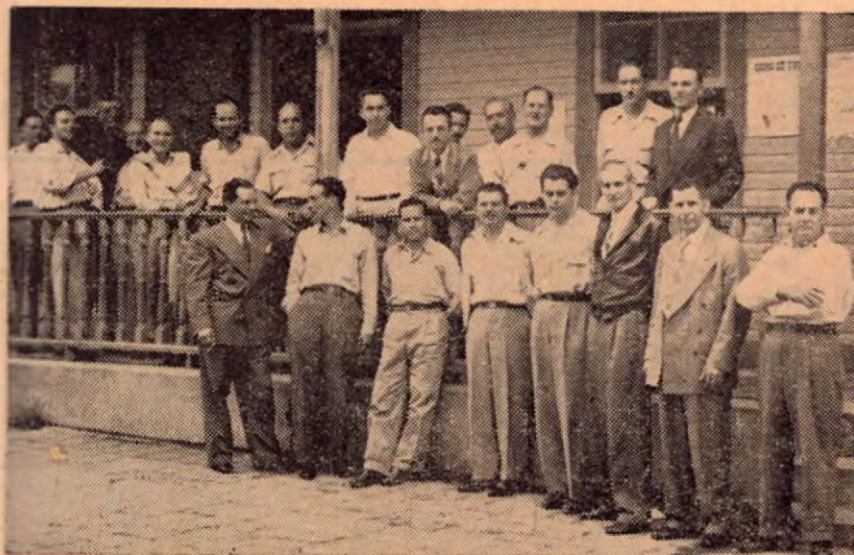
Recientemente llegó a Turrialba una Comisión de Diputados a estudiar sobre el terreno un plan para efectuar la apertura y trabajos de la carretera Turrialba-Siquirres-Limón. En la presente fotografía vemos esta Comisión del Legislativo, con un grupo de Municipales y vecinos importantes del lugar.

vados que ocurren en toda la línea férrea y desean que el Estado les repare la carretera a Carrillo, que inaugurada en 1865 por el ex-Presidente don Jesús Jiménez, estuvo en servicio por más de sesenta años, hasta que el ferrocarril vino a ponerla en desuso, y la cual con un gasto no mayor de quinientos mil colones podría acondicionarse y quedar apta para el servicio motorizado, asegurando así el tránsito entre la capital y el puerto de Limón. Dicen ellos que esta suma quedaría de sobra compensada con los beneficios que el país obtendría al darle una comunicación más segura