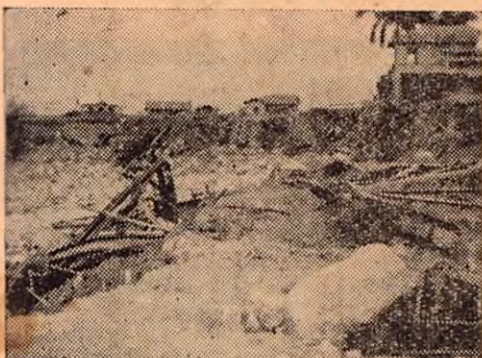
El puente de La Margot destruido por las recientes inundaciones.