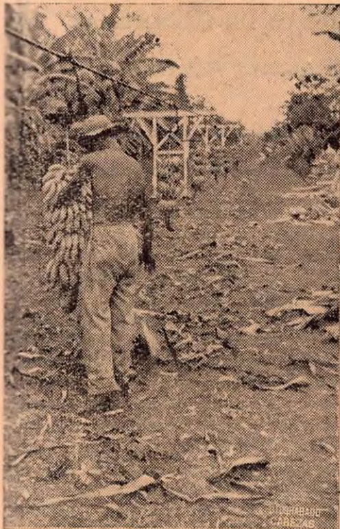
TRANSPORTE DE FRUTA

Los trenes bananeros cargan la fruta al otro lado del río en Puerto Cortés, la que es pasada de un lado a otro en andarivel. Véase al peón haciendo el trabajo de colgar los racimos en los ganchos.